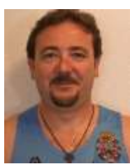
ANGEL NIETO CABALLERO